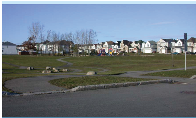
Figure 1. Exemple de bassin de rétention sec pour le réseau majeur (Rivard, 2008)

Un bassin sec peut être utilisé dans plusieurs contextes, comme des ensembles résidentiels de densité variable et des secteurs industriels ou commerciaux, et lorsque l'objectif poursuivi est de réduire les débits de pointe rejetés et d'agir également sur le contrôle de l'érosion en cours d'eau. Un bassin sec a un effet plus marginal sur le contrôle de la qualité s'il ne permet pas de retenue prolongée. Il devra dans ce cas être conçu comme un élément dans une série de mesures.