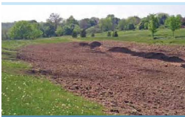
Figure 1. Aménagement avec épaisseur accrue de terre végétale (PDEP, 2006)

Puisque la structure des sols joue un rôle fondamental dans la génération des débits et des volumes de ruissellement, les techniques pour avoir un sol avec une capacité d'infiltration améliorée consistent à minimiser le remaniement des sols en place au cours de travaux et à utiliser des aménagements paysagers maximisant les capacités d'absorption du sol (GVRD et collab., 2005). Dans des conditions naturelles, avec un couvert végétal contenant beaucoup de matières organiques et des populations de vers et d'autres organismes, la capacité d'absorption du sol peut être très grande. Avec l'urbanisation, en remplaçant la couche de sol en place par une mince couche de terre végétale nivelée et compactée, les taux d'infiltration sont réduits de façon importante. Des analyses récentes (Pitt, 1999) ont permis d'établir que la compaction avait un effet notable sur la capacité d'infiltration des sols dits perméables après l'urbanisation.