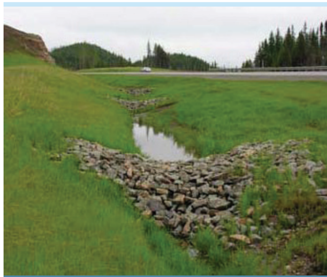
Figure 1. Bermes en fossé (Abrinord, 2008)

Les bermes doivent être inspectées après chaque pluie importante et être réparées au besoin.