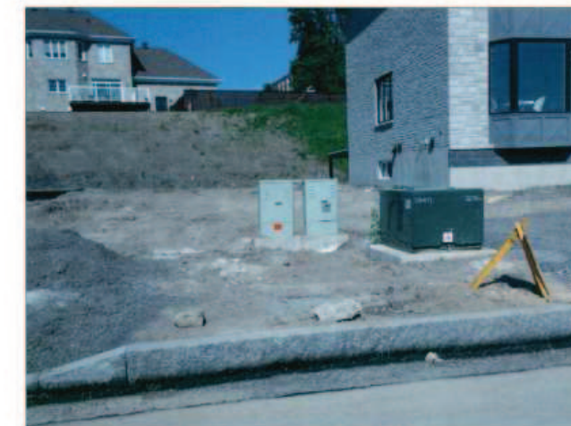
Préparé par : Hydro-Québec, mars 2012 Échelle : aucune