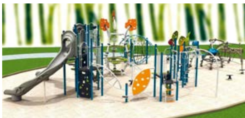
Voici la maquette des aménagements de l'aire des Groseilles dans le parc de l'Escarpe.

Un montant de 200 000 $ sera aussi investi dans l'aire de L'Islet-de-la-Montée afin d'y aménager, d'ici 2019, un parcours de jeux créant un lien avec les aires de jeux existantes.