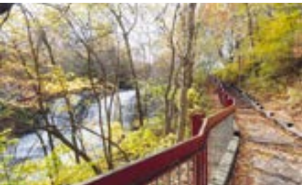
Rivière de Beauport

La Ville entre en période de planification pour déterminer les prochaines étapes. Vous serez consultés en cours de démarche sur les orientations et les projets mis de l'avant. D'ici là, redécouvrez vos rivières en profitant des sentiers et des aménagements existants et en publiant vos photos sur Instagram au #revonsnosrivieres .