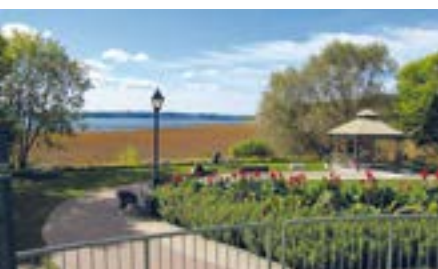
Rivière du Cap Rouge