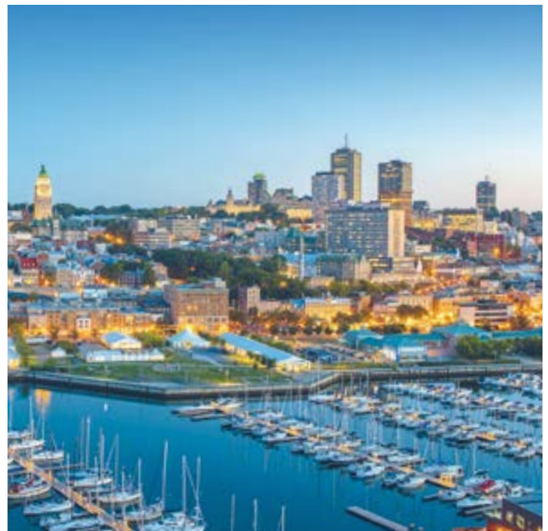
Cette nomination propulse Québec sur la scène littéraire internationale.

Pour en savoir plus : www.ville.quebec.qc.ca/litteratureUNESCO