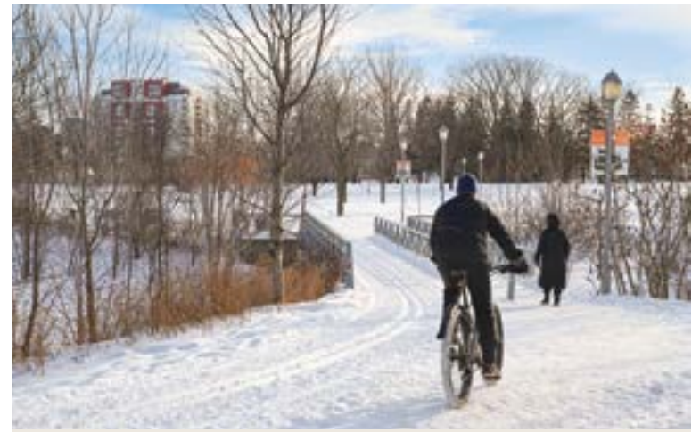
De nombreux projets seront déployés pour encourager la mobilité active et le transport en commun, contribuant ainsi à la santé humaine et à celle de la planète.

la Ville de Québec (incinérateur) afin d'assurer sa pérennité et sa performance;