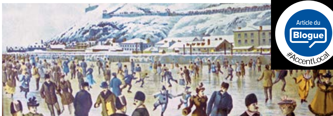
Patinage sur le fleuve Saint-Laurent à Québec, en 1894.