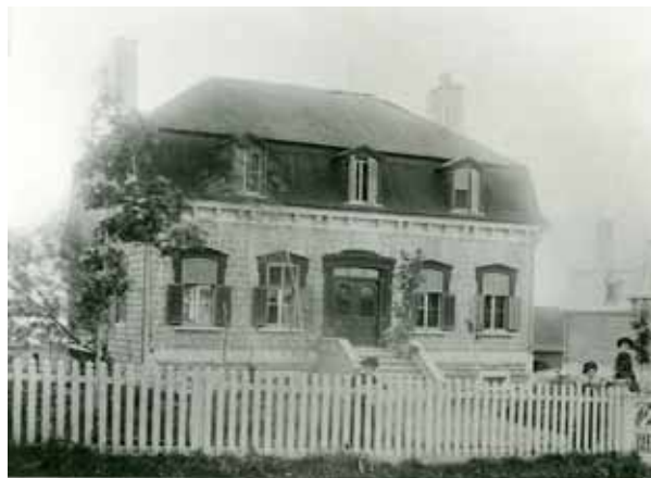
La maison Joseph-Édouard-Bédard vers 1885.

La maison Joseph-Édouard-Bédard est construite en 1877, d'après les plans de l'architecte Georges-Émile Tanguay. La vaste résidence demeure dans le patrimoine familial jusqu'en 1960.