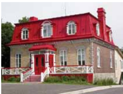
La maison Pierre-Dumontier.