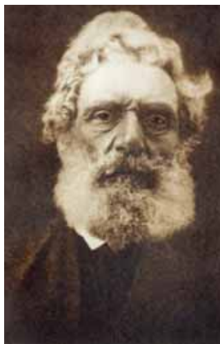
Le docteur James Douglas. Médecin originaire d'Écosse, il s'installe à Québec en 1826 et se crée rapidement une bonne clientèle, corrigeant avec succès, dit-on, le strabisme et les pieds bots. Il assume la direction de l'hôpital de la Marine et des Émigrés à Québec en 1837.

À la demande du gouverneur Metcalfe, le docteur Douglas accepte de fonder un établissement pour prendre soin des aliénés de la province, dont les conditions de vie sont jugées déplorables. L'ancien manoir seigneurial est transformé pour abriter le personnel et l'administration. En 1845, l'asile de Beauport ouvre ses portes, accueillant 82 malades mentaux transférés de la prison de Montréal et des hôpitaux de Québec et de Trois-Rivières. Plusieurs n'avaient pas vu le soleil depuis des années. Ils sont logés dans une vaste dépendance à l'est de l'ancien manoir, réaménagée à leur intention. Dégagés de leurs liens, ils jouissent désormais de plus de liberté et peuvent s'employer à des travaux agricoles sur la propriété. Le thérapeute obtient d'excellents résultats, puisque plusieurs malades voient leur état s'améliorer au point de pouvoir retourner dans leur famille.