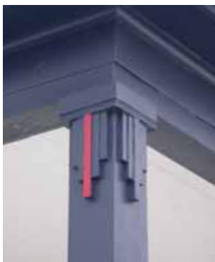
Boiserie ornementale de l'annexe. Le motif géométrique des boiseries s'inspire du vocabulaire Art déco largement diffusé par les architectes diplômés de l'École des beaux-arts de Québec.

Des formes inspirées du Second Empire, la maison reprend le toit brisé à deux eaux, qui offre une alternative intéressante au toit à deux versants en permettant de transformer le grenier traditionnel en étage habitable. L'intervention de l'architecte Adrien Dufresne sur sa résidence demeure discrète. De l'extérieur, l'annexe présente un volume simple, en retrait du corps principal. C'est plutôt à l'intérieur que l'architecte a soigné le décor, dans des espaces qu'il voulait fonctionnels.