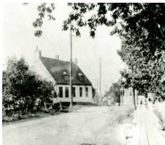
La maison Pierre-Marcoux vers 1910. À cette époque, l'avenue Royale n'est encore qu'un chemin de terre bordé du côté nord par un trottoir de bois.

Construite sur la terre de Pierre Marcoux concédée au XVII e siècle, la maison est l'une des plus anciennes de Beauport. Elle témoigne des modes d'implantation sous le Régime français. Jusqu'en 1921, elle tournait le dos à l'avenue Royale, avec sa façade principale au sud. La laiterie, traditionnellement bâtie en appentis au nord-est de la demeure, est conservée, de même que la vieille grange. Neuf générations de Marcoux ont habité sur cet emplacement.