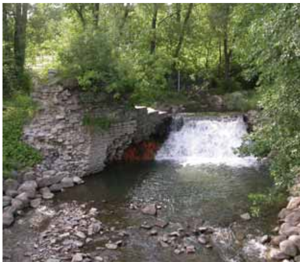
Les vestiges du barrage du moulin Brown.