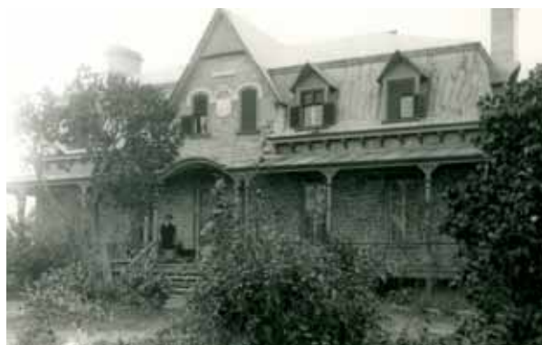
L'ancienne maison des Salaberry subit des dommages lors de l'incendie qui détruit le moulin Brown en 1882. Aussitôt reconstruite par les héritiers Gury, elle est dotée d'un toit mansardé à quatre versants interrompu par un pignon en façade. L'édifice est démoli en 1969 ou peu après.