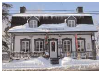
La maison Adrien-Dufresne. Photo : Les Alliés, 2006.