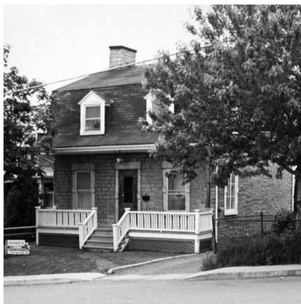
La maison Joachim-Nolet vers 1960.