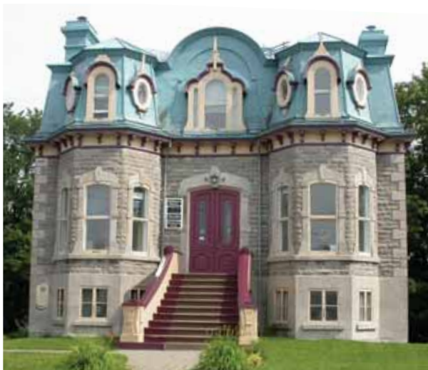
La maison Joseph-Désiré-Marcoux. Photo : Les Alliés, 2004.

Construite vers 1885 d'après les plans de l'architecte Elzéar Charest, la maison du notaire Marcoux est l'une des plus remarquables de l'avenue Royale. L'imposante demeure est représentative des villas suburbaines que l'on retrouvait sur la Grande Allée à la même époque. Deux oriels montant de fond encadrent l'escalier monumental conduisant au rez-de-chaussée. La pierre à bossage est souvent préférée pour ses qualités esthétiques, alors que la pierre de taille, qui peut être sculptée, est réservée aux chaînages d'angle, aux chambranles des ouvertures et au soubassement élevé.