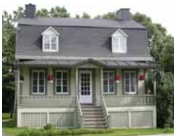
La maison Isidore-Vallée.

L'exception qui confirme la règle! Si la majorité des habitations de Beauport sont en pierre, quelques maisons font exception, dont celle en bois construite par le menuisier Isidore Vallée et revêtue d'un crépi pour imiter la pierre.