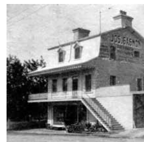
La maison Joseph-Abraham-Gagnon au début du XX e siècle. Archives de la Société d'art et d'histoire de Beauport, fonds Gagnon-Saulnier.

L'oriel désigne un ouvrage en saillie du mur sur plus d'un étage. Il est dit « montant de fond » s'il s'élève à partir des fondations ou « en surplomb » s'il anime les étages supérieurs. L'ouvrage en saillie est présent sur un seul étage? C'est la logette. Tous deux sont particulièrement appréciés à la fin du XIX e siècle.