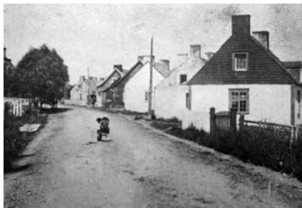
Les premières maisons villageoises s'alignent en dents de scie le long de l'avenue Royale.

Bâties au dernier quart du XIX e siècle, ces demeures ont des caractéristiques communes. De plan massé, presque carré, les maisons en pierre s'élèvent sur deux étages couverts d'un toit mansardé. Ce type de toiture est très populaire à cette époque, puisqu'il permet d'augmenter l'espace habitable dans les combles à moindres frais.