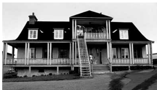
La maison Salaberry—Juchereau-Duchesnay à la fin des années 1960. MCCO, Inventaire monumental.

Bien que ravagée par un incendie en 1997, cette maison est le seul témoin de la présence des grandes familles Juchereau Duchesnay et d'Irumberry de Salaberry à Beauport.