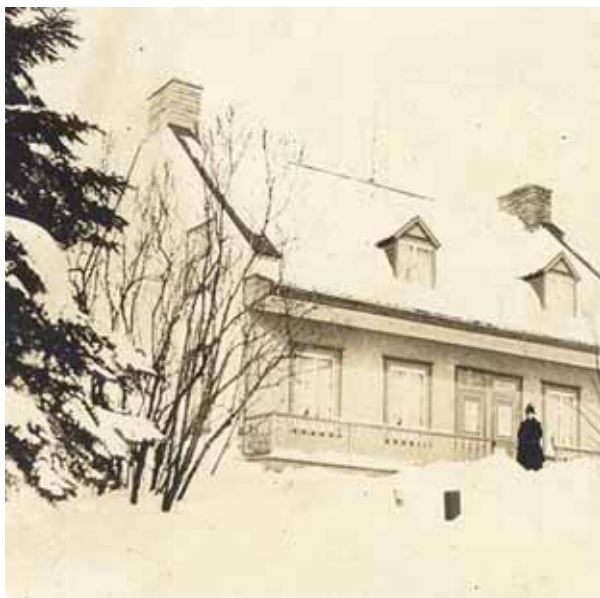
La maison Joseph-Mercier dans les années 1950.

Typiques de l'évolution de la maison québécoise sont la hauteur du soubassement, la galerie aménagée sur toute la façade et le larmier retroussé prolongeant la toiture. La maison se caractérise par sa composition néoclassique. L'escalier principal est dans l'axe de la double entrée, flanquée de fenêtres de grandeurs uniformes, réparties symétriquement. Les lucarnes de la toiture sont disposées en fonction des ouvertures du rez-de-chaussée. Joseph Mercier et ses descendants ont habité la maison pendant plus de 100 ans.