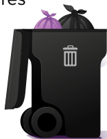
Collecte par bac

Les sacs mauves remplis de résidus alimentaires doivent être déposés au même endroit que les sacs d'ordures (bac roulant ou conteneur à ordures).