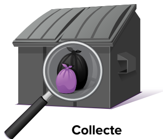
Collecte par conteneur